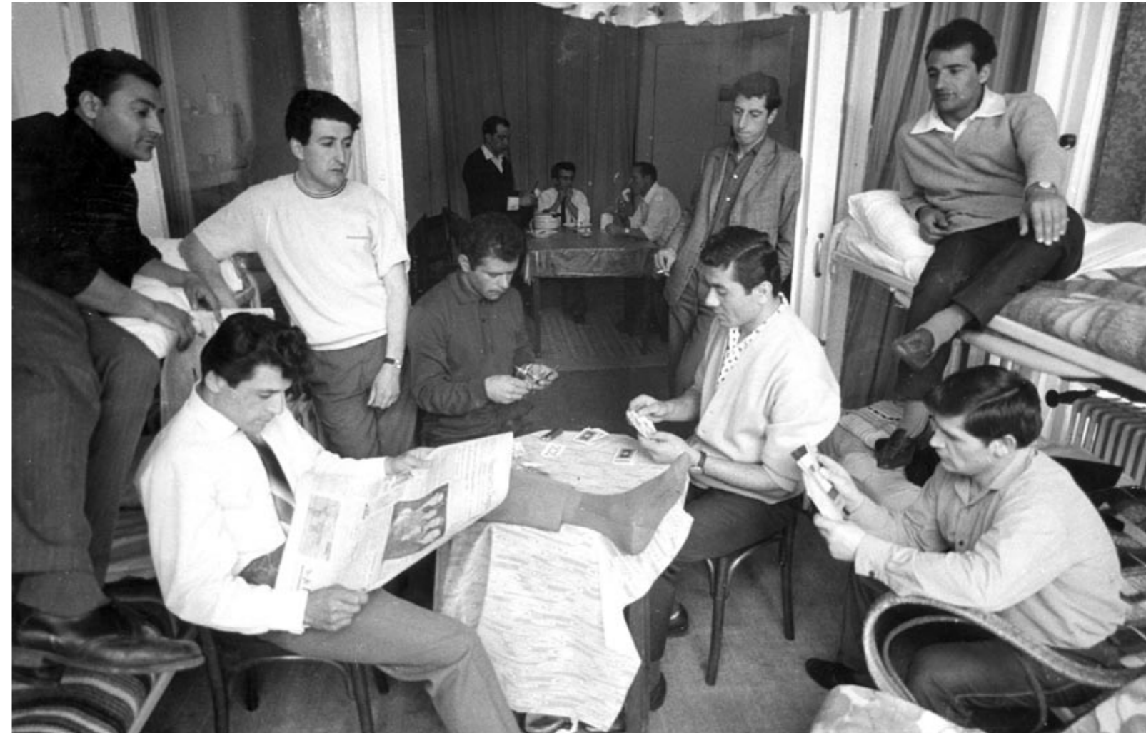
Foto rechts: Woonruimte gastarbeiders: Vijf Marokkaanse en acht Turkse gastarbeiders op hun kamer(s). De Marokkanen betalen samen vierhonderd gulden huur per maand voor de ene kamer, de acht Turken 640 gulden voor de kamer ernaast. Datum onbekend.

bijeenkomsten vormen natuurlijk ook een mooie gelegenheid om uit te leggen waarom mensen lid zouden moeten worden van de FNV. Als mensen lid zijn van de bond, kunnen ze ook invloed uitoefenen."